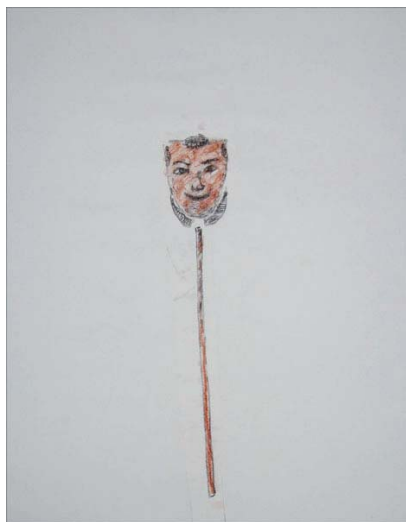
Евгений Дедов, Без названия, 2018 рисунок на бумаге 50 x 40 см

06 – 29 марта, 2 - 13 апреля Открытие 5 марта в 19:00