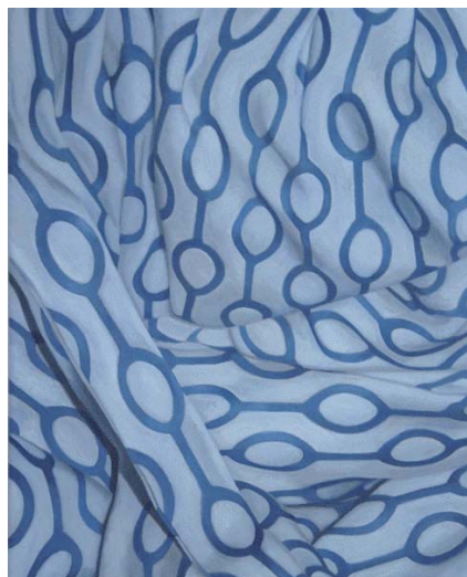
Евгений Дедов, Компаньон, 2018 холст, масло 30 x 37 см

Галерея современного искусства «Треугольник» рада впервые представить в своём пространстве персональную выставку Евгения Дедова «Компаньон».